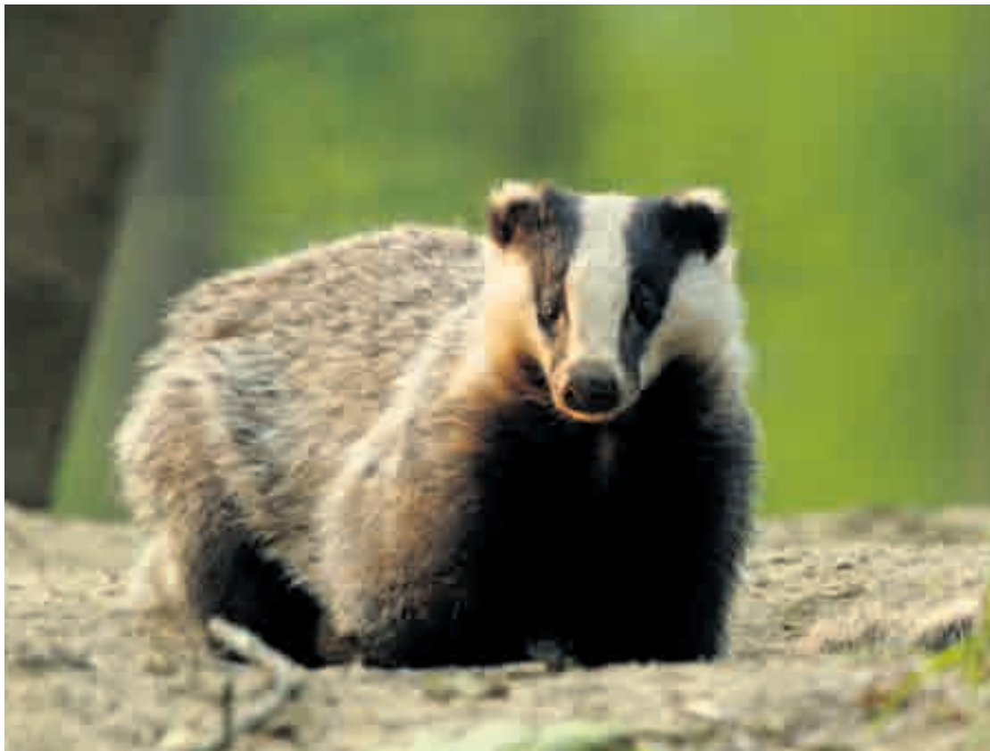
De das: nu nog goed beschermd, maar in de nieuwe Wet natuur vogelvrij.

▶ Aaldrik Pot is lid van de Dassenwerkgroep Drenthe