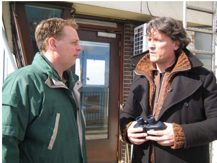
Het Waddengebied: onderzoek en lokale participatie