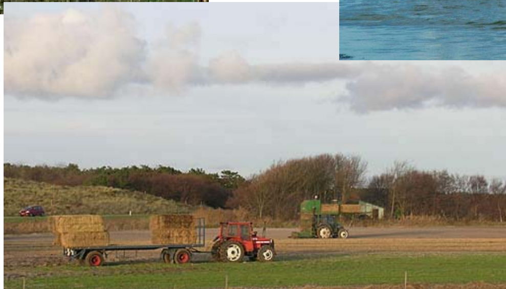
Het Waddengebied als cultuurlandschap