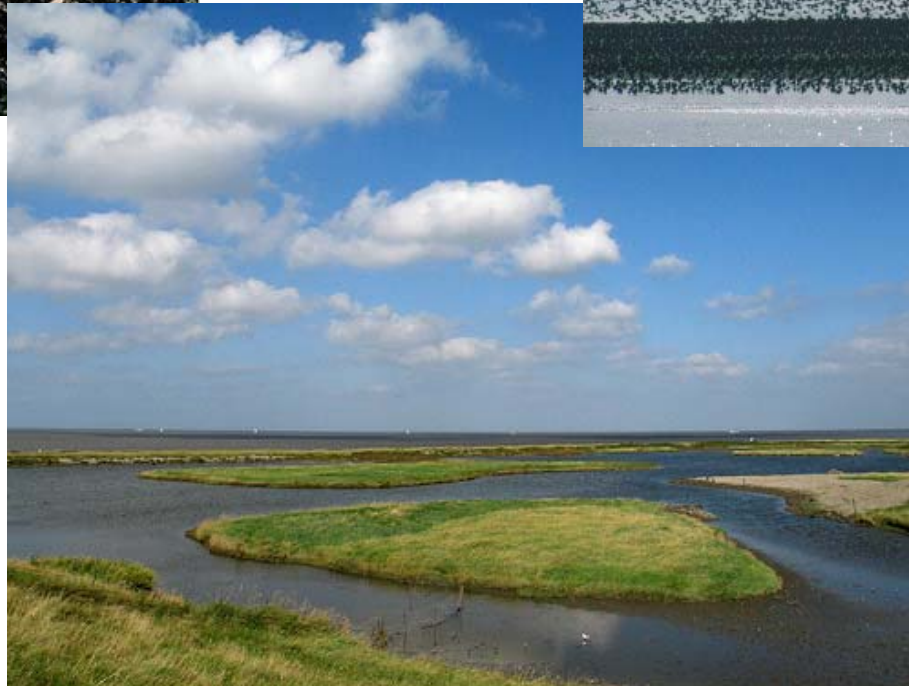
De Wadden als natuurgebied