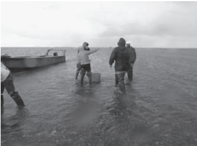
Oesters rapen en eten bij eb (Jos Bosman)

Waddenvereniging pleitte hij voor het alternatief om de bestaande dijk te verhogen en het buitendijks gebied te laten zoals het is. Na aandacht voor de keuze tussen de twee alternatieven in het dagblad Trouw , in 1978, ging het plan voor de laatste inpoldering van het buitendijkse gebied in 1979 van de baan. 'Pootaard-appelen zijn mooi voor Friesland maar de Waddenzee is nog mooier' zei toen premier Dries van Agt. 14 De uitspraak getuigt van een bewustwording en veranderd begrip van de Waddenzee in Nederland, terwijl het in de beleving van de Duitse burens nog steeds om de Noordzee ging, waar zij bij gebrek aan strand in diezelfde jaren zeventig ijverig het buitendijkse wad met zand opspotten, ter uitbreiding van de zonnebaadcapaciteit op de er tegenover gelegen overvolle Waddeneilanden. Nederland kent ook een hoek vlakbij de Duitse grens waar hetzelfde voor een ander doel gebeurde. Een enorm stuk wad werd met zand opgespoten als stabiele basisvorm voor de contour van de Eemshaven. De aanleg van de Eemshaven is posthuum uitgevoerd naar ontwerp van waterstaatkundig ingenieur Johan van Veen, die overleed in 1959. De Provinciale Staten van Groningen besloten in 1968 de Eemshaven te realiseren. Het begin van de aanleg startte in 1972 en de haven werd al in juni 1973 door koningin