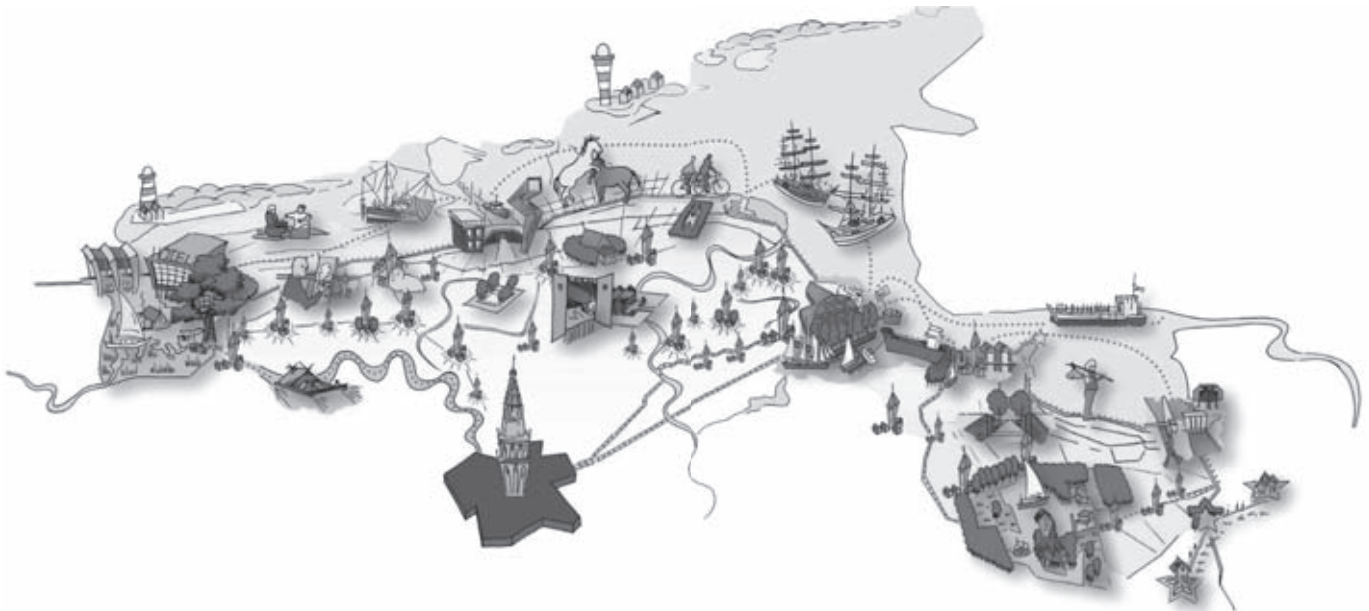
Waddenkroon, schets van bureau Bosch en Slabbers