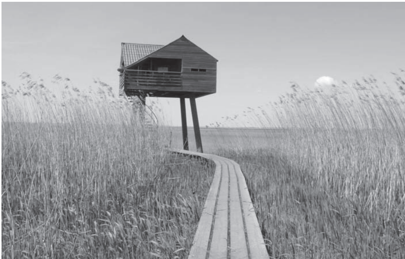
De vogelkijkhut Kiekkaaste in Nieuwe Statenzijl (Jos Bosman)

dijk aanleggen, op locaties waar tot dusver nog geen fietspad bestaat, zodat een lange fietstocht langs de Waddenzee mogelijk wordt in 2015. In Friesland wordt daar blijkbaar anders over gedacht dan in Groningen, want It Fryske Gea stelt dat fietsen voor langs de dijk vrijwel overal in Friesland mogelijk is, maar dat dat niet wenselijk wordt geacht. 26