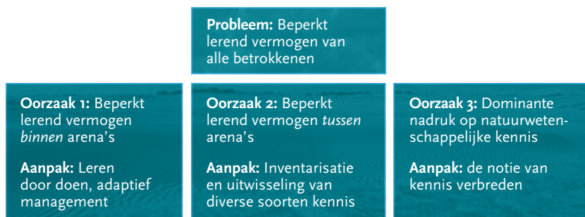
Figuur 2 Het beperkt lerend vermogen verklaard door drie oorzaken