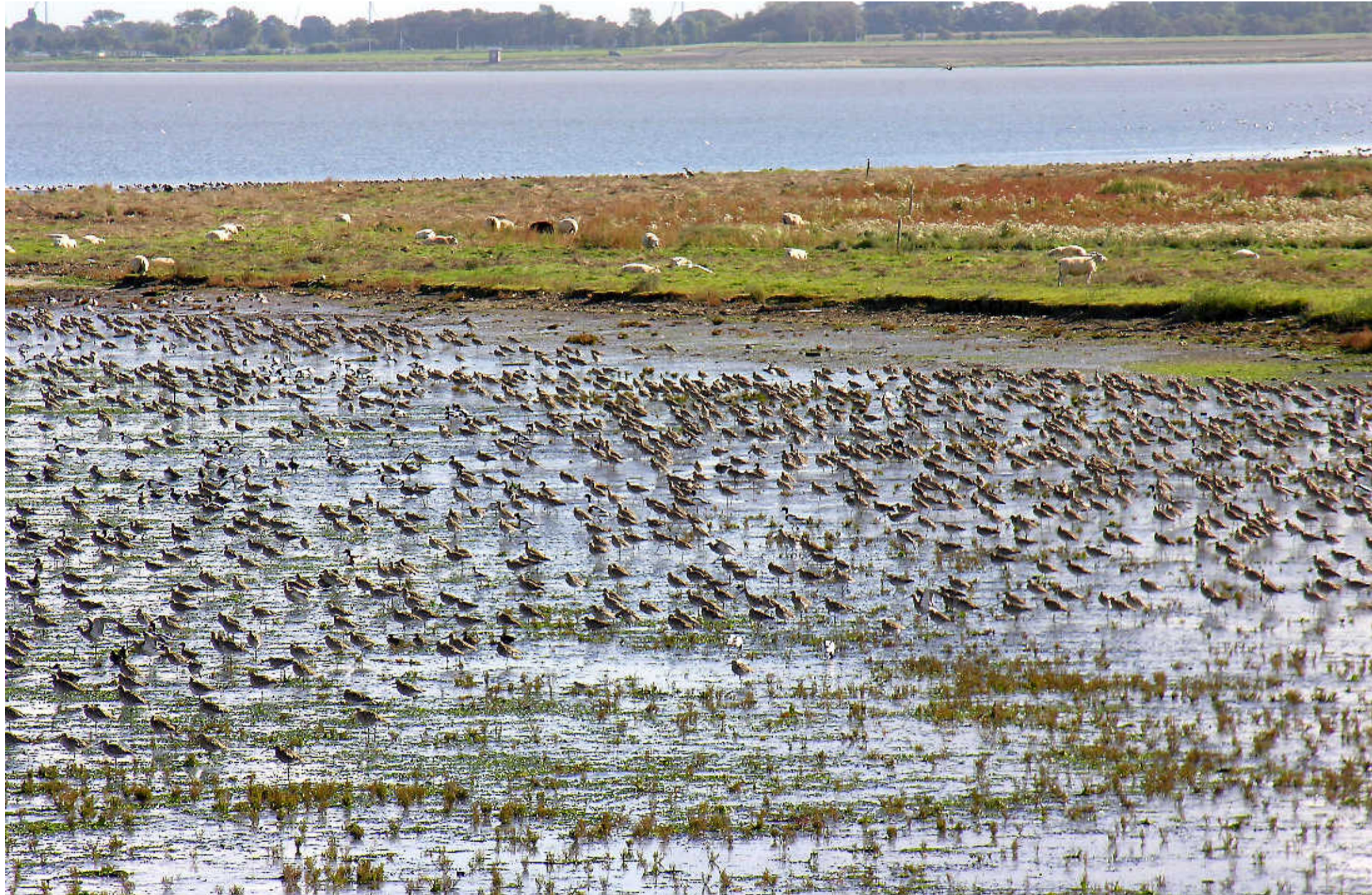
Wulpen op het Balgzand.

In het ecologisch onderzoek 'Mogelijke effecten op vogels bij openstelling van de binnenkant van de Balgzanddijk' door Altenburg & Wymenga in opdracht van de Waddenacademie, zijn veel feiten en cijfers uiteengezet. Dit omdat er de afgelopen jaren meerdere malen een verzoek is ingediend om de werkweg aan de binnenzijde van de Balgzanddijk open te stellen voor publiek. Eddy Wymenga wist in zijn presentatie aan wethouders van de gemeenten Den Helder en Hollands Kroon en Landschap Noord-Holland met praktijkvoorbeelden het belang van het behoud van dit deel van het Balgzand als afgesloten gebied te schetsen. De invloed van fietsers en wandelaars is in de verschillende seizoenen groot, zelfs op momenten dat er tijdens de zomer-