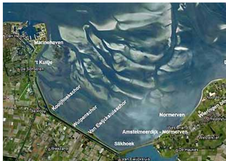
Plekken waar wadvogeltellingen zijn verricht.

dijk zullen wadvogels zich aanpassen. Zoals steltlopers, eenden, ganzen en meeuwen zich na het inpolderen van de Anna Paulowna- en Koegraspolder polder en de aanleg en verhoging van dijken hebben aangepast. Het verdwijnen van meer hoogwatervluchtplaatsen langs de dijken heeft echter een behoorlijk invloed en kan leiden tot het verdwijnen van veel vogelsoorten, is de conclusie van het gepresenteerde ecologisch onderzoek. Vertegenwoordigers van beide betrokken gemeenten en Landschap Noord-Holland hebben na de presentatie van het rapport aangegeven dat dit niet hun wens is. Na de gemeenteraadsverkiezingen kijken zij of er alternatieve routes mogelijk zijn om te genieten van het Balgzand, deel van werelderfgoed Waddenzee.