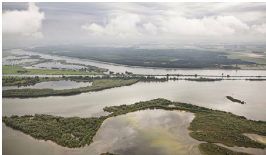
De deltabeslissingen moeten ervoor zorgen dat ons land niet alleen nu, maar ook de komende honderd jaar, veilig is voor water en over genoeg zoetwater beschikt. Het IJsselmeergebied.

De Stuurgroep Deltaprogramma heeft eind november de stand van zaken en waar mogelijk en nodig de richting bepaald van de deltabeslissingen en voorkeursstrategieën (zie ook het artikel over de stuurgroep Deltaprogramma). Deze bouwen voort op het Deltaprogramma 2014. We staan nu aan de vooravond van de definitieve besluitvorming.