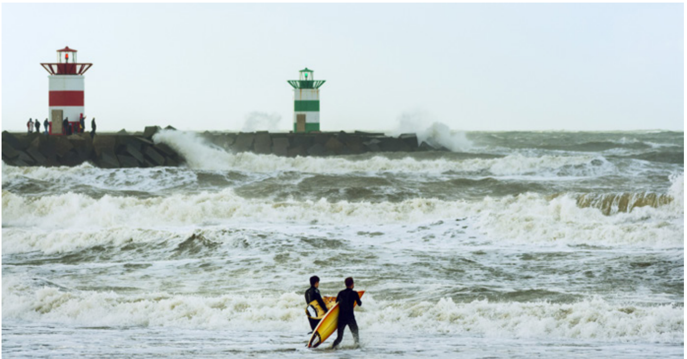
Storm dit najaar bij Scheveningen.

Maandag 18 november sprak minister Schultz van Haegen van Infrastructuur en Milieu in het Wetgevingsoverleg Water met de waterwoordvoerders van de Tweede Kamerfracties over een groot aantal waterissues, waaronder het Deltaprogramma 2014. Ter voorbereiding op dit overleg had deltacommissaris Wim Kuijken enkele dagen daarvoor met de waterwoordvoerders van gedachten gewisseld over het Deltaprogramma 2014.