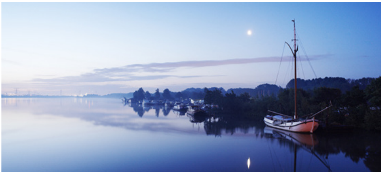
Ochtend aan het Brielse Meer, Zeeland.