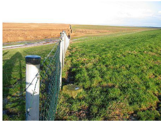
Grenssteen 203/2 op de dijk bij Nieuwe Statenzijl. Links van het hek Nederland, rechts Duitsland.

1924 is neergezet, maar is geen onderdeel van het systeem van officiële grenspalen die onze grens met Duitsland markeren. De laatste grenssteen heeft nummer 203/2.